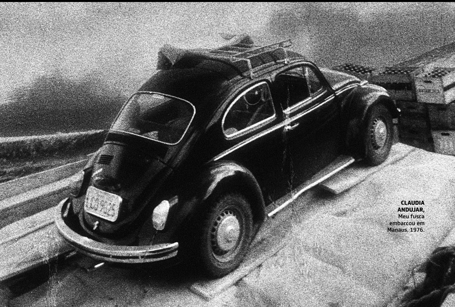
CLAUDIA ANDUJAR, Meu fusca embarcou em Manaus, 1976.