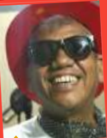
BETO MÊNEIS (ator, compositor, dramaturgo e músico)