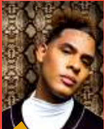
MATEUS FAZENO ROCK (ator, compositor e músico)