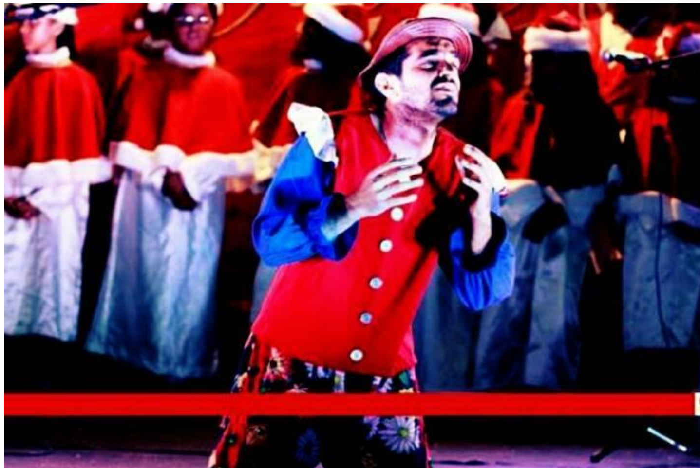
UM CONTO DE NATAL (2015)

O ESPETÁCULO FOI O INÍCIO DESSA CAMINHADA. CONTINHA AS MANIFESTAÇÕES POPULARES, ASSIM COMO O TEATRO, DANÇA, CORAL, MÚSICA E CANTO. REALIZADO NA PROGRAMAÇÃO DO PRIMEIRO EDITAL DE NATAL DE PACAJUS