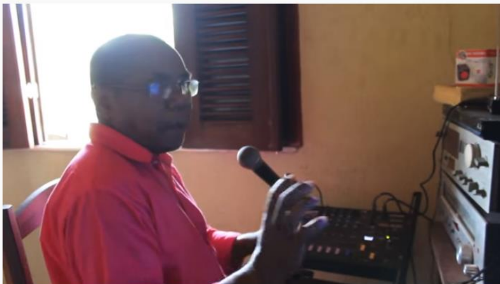
LabCEUs | Rádio Raízes do Quilombo