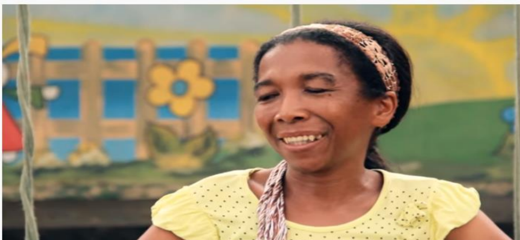
Fábrica de Imagens - Nêgas de Pano