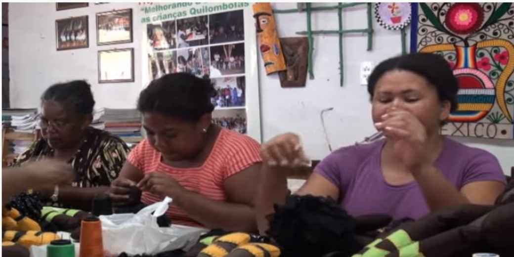
Fábrica de Imagens - Visita a comunidade quilombola de Alto Alegre

https://www.youtube.com/watch?v=ImL9xBuXmg0