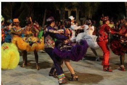
O Festival acontece até domingo, dia 23, numa cidade cenográfica montada entre o Estoril e o Largo do Mincharia

O ritmo e a beleza das quadrilhas vão tomar conta do calçadão da Praia de Iracema a partir desta quarta-feira (19), às 20 horas, quando acontece o Arraiá do Ceará , festival, que integra a programação da Fortaleza Junina – Uma homenagem a Elzenir Colares . O Festival acontece até domingo, dia 23, numa cidade cenográfica montada entre o Estoril e o Largo do Mincharia, e receberá as 30 melhores quadrilhas cearenses, de acordo com o ranking da Federação das Quadrilhas Juninas do Estado do Ceará.