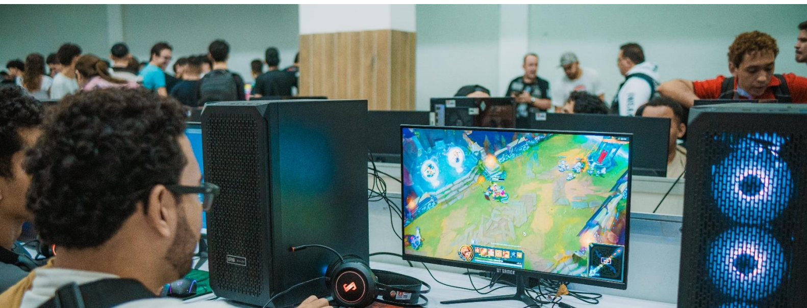
Figure 12 Caju Gamer Con 2026