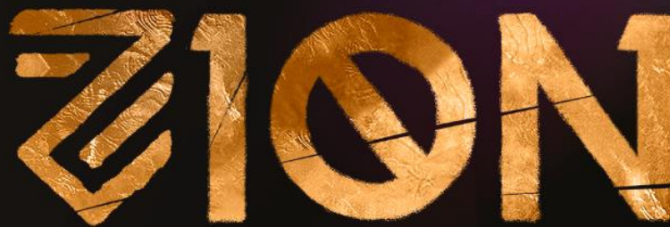
Figure 1 logo z1on

O portfólio a seguir detalha a missão, a trajetória, as realizações e os planos futuros da Z1ON, com indicadores e evidências que comprovam seu papel de destaque no cenário de cultura digital e economia criativa do Vale do Caju e região. O documento sugere também elementos de diagramação (uso de imagens, tipografia, estrutura de títulos) para conferir profissionalismo e identidade visual aos materiais de divulgação e captação de recursos. Ao final, apresenta-se um checklist de anexos (certificados, fotos, atas) e um convite à integração de novos apoiadores, reafirmando o compromisso da Z1ON em transformar cultura digital em pertencimento, criatividade e futuro para as juventudes.