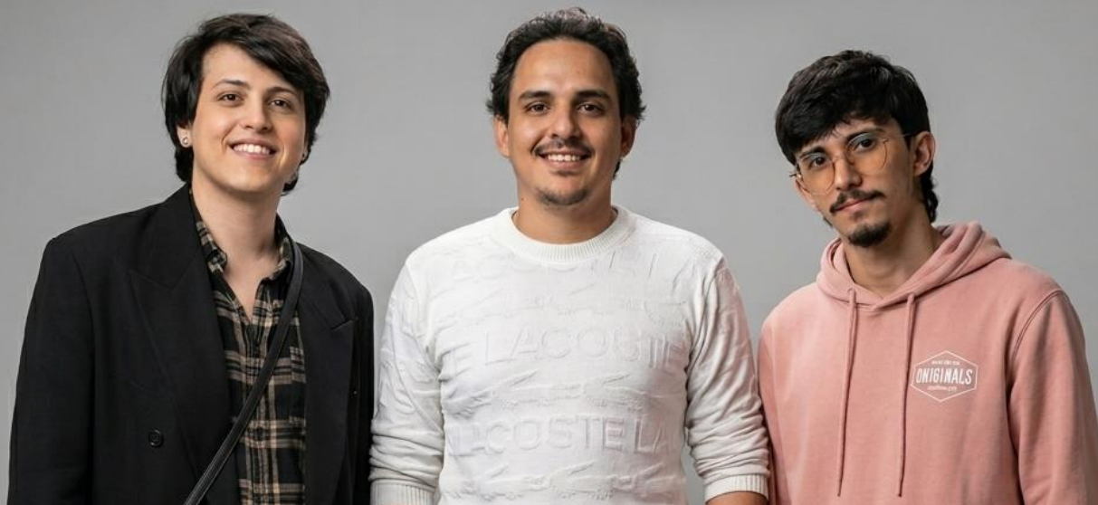
Figure 4 Foto Oficial Diretor de Comunicação, Vice- Presidente e Presidente da Z1ON

A Z1ON adota práticas administrativas inspiradas em associações culturais, promovendo reuniões periódicas, prestação de contas e participação coletiva nas decisões. Está em curso o processo de formalização jurídica como associação cultural , previsto para conclusão até o final de 2026 , garantindo sustentabilidade, captação de recursos públicos e consolidação institucional.