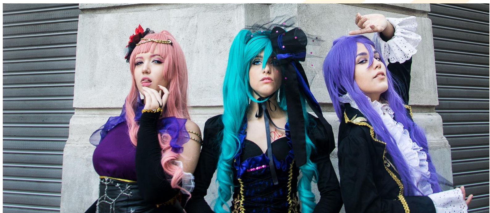
Figure 10 Estudio Tokyo Day 2018

O Estudio Tokyo Day integra a rede de ações da Z1ON, contribuindo para a expertise do coletivo em cosplay e fotografia, valorizando a arte geek regional. Também estimulou jovens talentos na produção de conteúdo visual profissional.