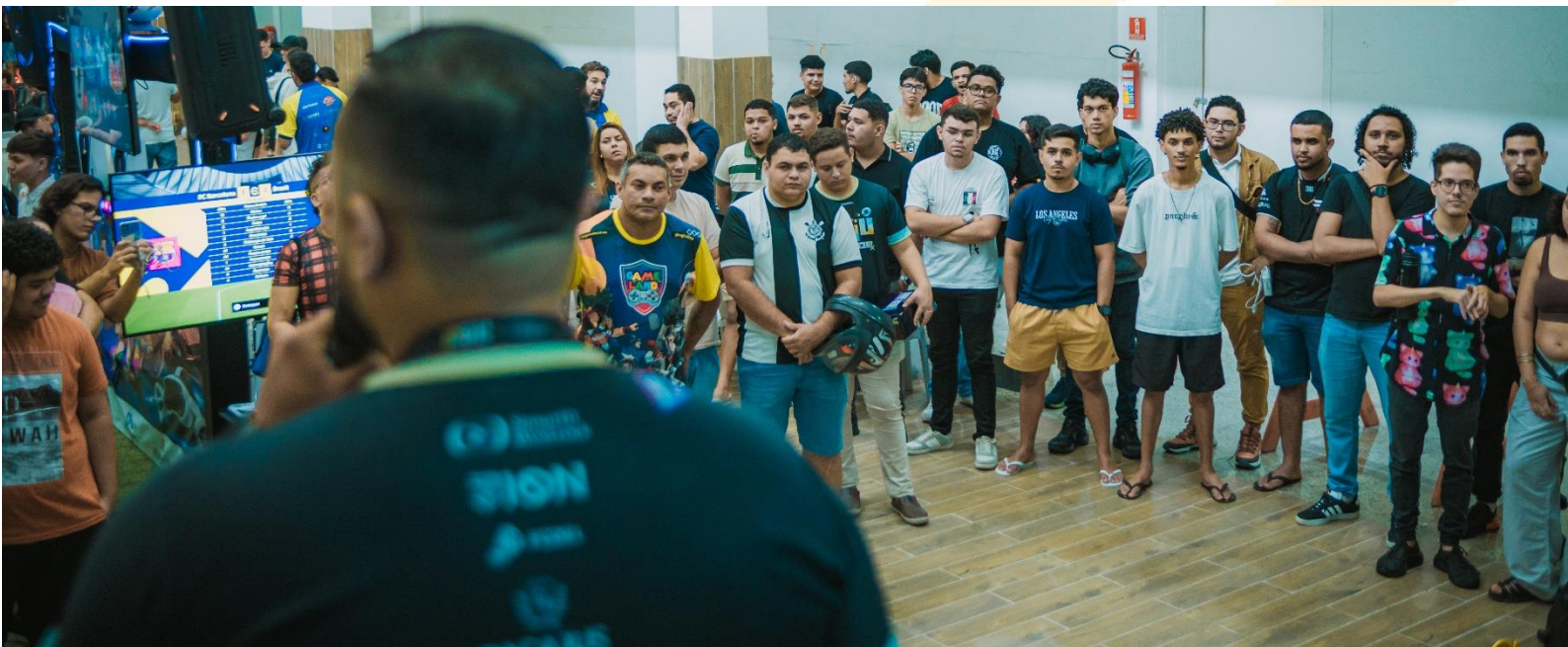
Figure 2 palestra com o nosso diretor administrativo

Atuando em rede colaborativa, a ZION desenvolve projetos que integram juventude, arte, esportes eletrônicos, cosplay, música, audiovisual e empreendedorismo criativo. A partir de 2020, especialmente durante o período de isolamento social, o coletivo migrou grande parte de suas ações para plataformas online, oferecendo suporte, entretenimento e capacitação a centenas de jovens. Em 2026, a ZION foi certificada como Ponto de Cultura pelo Ministério da Cultura , reconhecimento que valida seu impacto socioeducativo e cultural na região.