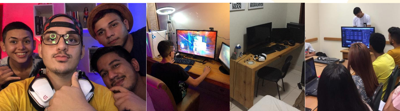
Figure 7 Novo Espaço da Z1ON (CE)

Na época, firmaram-se parcerias iniciais com a Prefeitura de Pacajus e com instituições de ensino locais, viabilizando espaços para eventos e laboratórios de informática para oficinas gratuitas.