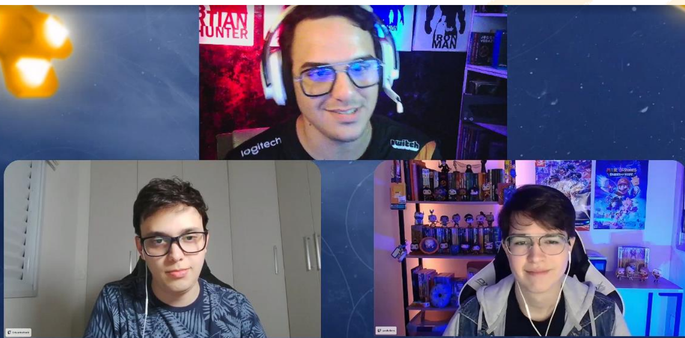
Figure 9 Capacitação de criação de Conteúdo com o Mundo Avatar

Esses cursos qualificaram mais de 40 jovens, muitos dos quais iniciaram canais próprios ou freelas em marketing. A iniciativa promoveu inclusão produtiva e fomento à economia criativa na região.