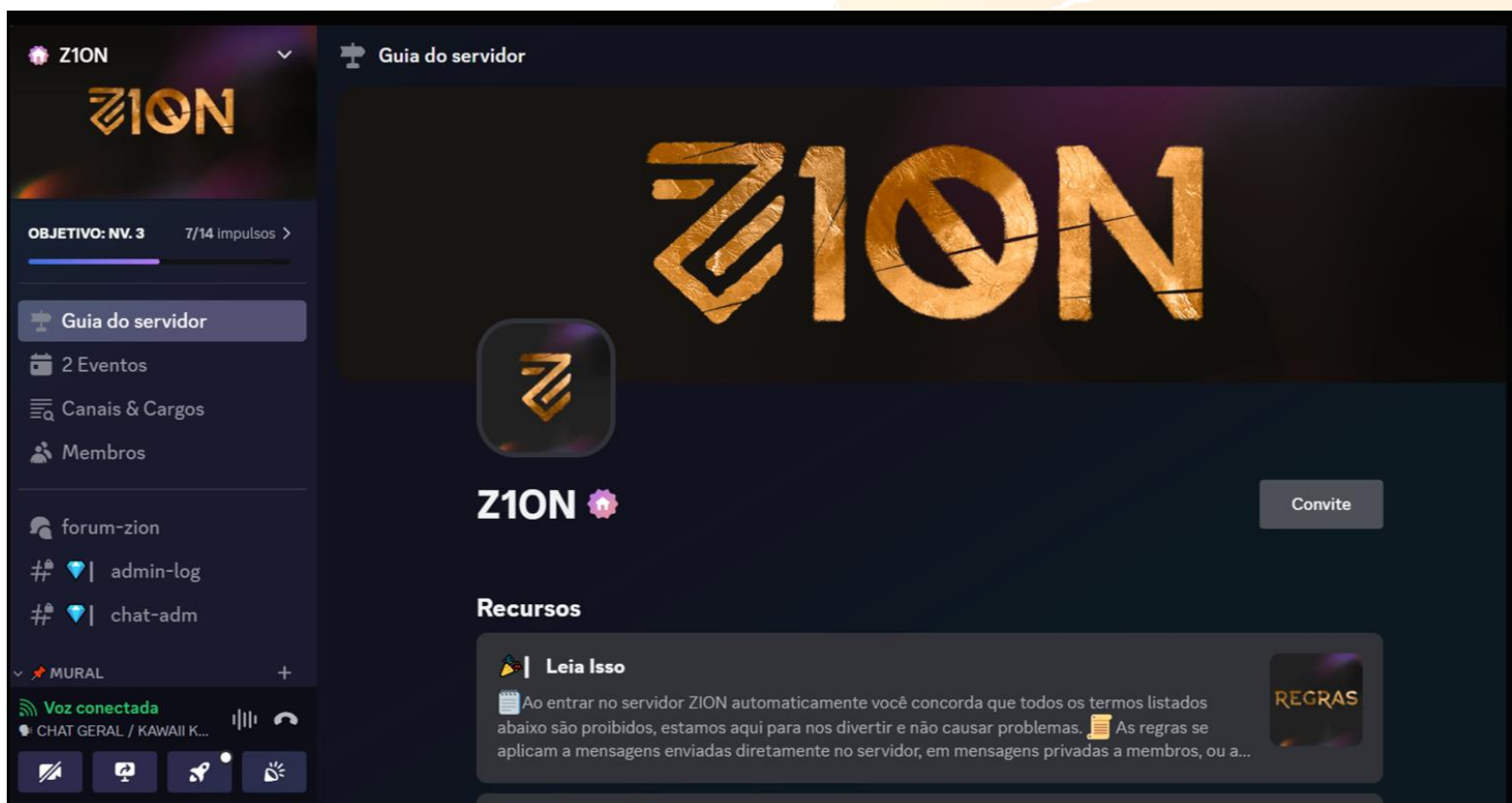
Figure 5 Servidor do Discord da ZION

Inicialmente informal, a comunidade do Discord passou a promover encontros virtuais semanais, campeonatos de jogos online (notadamente Destiny 2 ), sessões de streaming colaborativas e grupos de estudo. Em meados de 2022, consolidou-se a identidade do coletivo, oficializando-se o nome ZION e estabelecendo as bases para ações presenciais futuras. A origem em ambiente digital reforça o DNA tecnológico do coletivo, que valoriza ferramentas digitais para integrar pessoas de diferentes cidades e promover inclusão social.