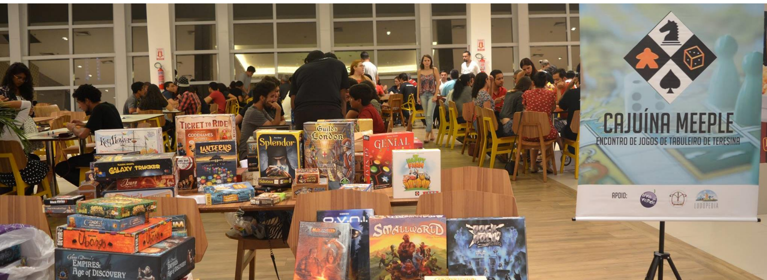
Figure 6 Primeiro Cajuina Meeple ( Shopping Rio Poty - 2016)